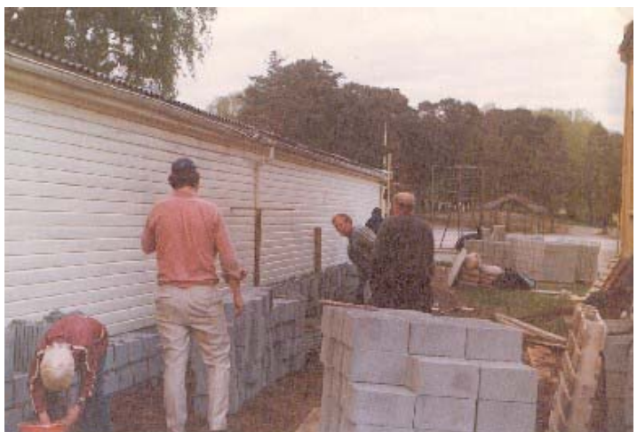
BILDE: Fra den store dugnaden i 1976.

25-27/1-1978 var det predikantkonferanse på "Salem".