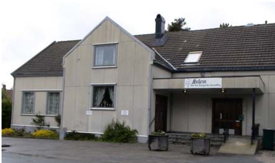
BILDE: Menighetslokalet Salem i dag.